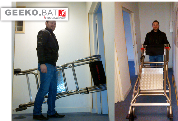
PLATE-FORME GEEKO BAT